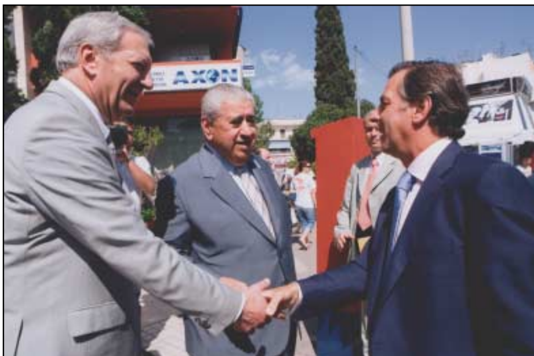
Ο Πρόεδρος του Ο.Α.Σ.Θ. κος Παπαδόπουλος και ο Αντιπρόεδρος κος Στεφανίδης, ανταλλάσσουν θερμή χειραψία με τον Υπουργό Μεταφορών κο Λιάπη, κατά την αναχώρησή του. Η ιστορική υπογραφή της ανανέωσης της Σύμβασης που έχει προηγηθεί λίγο νωρίτερα, αποτελεί γεγονός.

οι Μέτοχοι του Ο.Α.Σ.Θ., θα ανταποκριθούν απολύτως στις προσδοκίες για την βελτίωση της ποιότητας των προσφερομένων υπηρεσιών...».